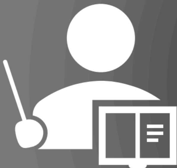
專任人員 (含專案人員)